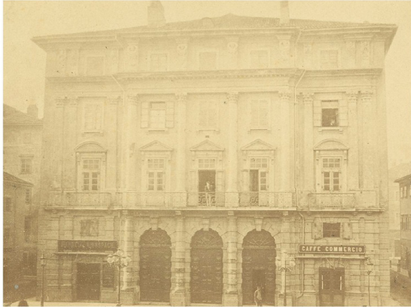
Sjeverno pročelje Adamićevog (Gradskog) kazališta, fotografija snimljena 1883. g., pred rušenje

K azalište je tijekom 80-godišnjeg postojanja bilo više puta obnavljano, uređivani su unutrašnjost i pročelja, popravljana scenska tehnika, a veći zahvat izveden je 1855. kad je podignuto krovšte pozornice. Kazalište je nekoliko puta bilo i mjesto za uvođenje tehničkih inovacija. Tako su 1840. na više mjesta ugrađeni zahodi sa sifonom, prvi takvi u Rijeci, a moguće i u Hrvatskoj. Godine 1860. u kazalište je uvedena plinska rasvjeta