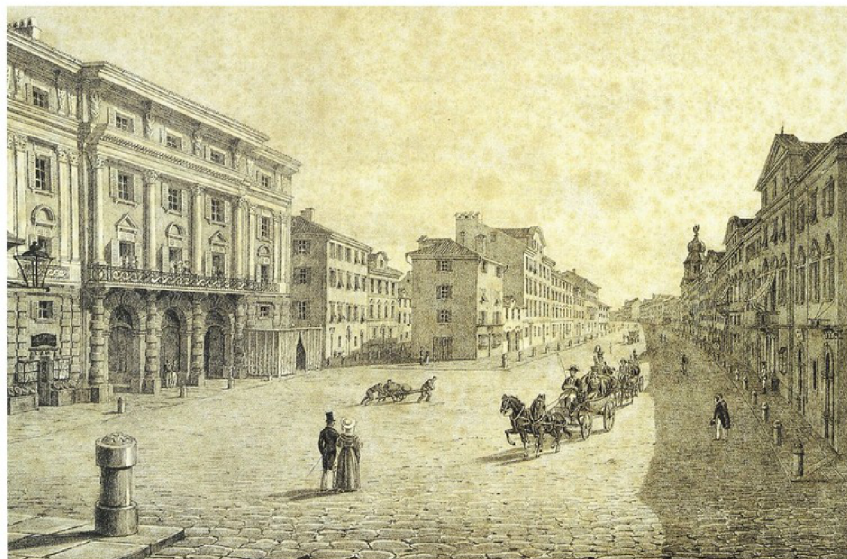
Pogled na Adamićevo kazalište i Korzo tridesetih godina 19. st.

Kazalište je tijekom 80-godišnjeg postojanja bilo više puta obnavljano, uređivani su unutrašnjost i pročelja, popravljana scenska tehnika, a veći zahvat izveden je 1855. kad je podignuto krovšte pozornice. Kazalište je nekoliko puta bilo i mjesto za uvođenje tehničkih inovacija. Tako su 1840. na više mjesta ugrađeni zahodi sa sifonom, prvi takvi u