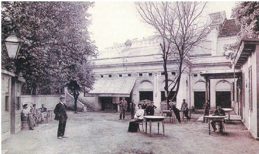
(Amfi)teatro Ricotti-Fenice na Dolcu, pogled na južno pročelje

Izdavači knjige Nane Palinić »Riječka kazališta« su Državni arhiv u Rijeci i Građevinski fakultet u Rijeci, a više informacija o knjizi može se naći na adresi: http://www.gradri.uni-ri.hr/hr/knjiznica.html