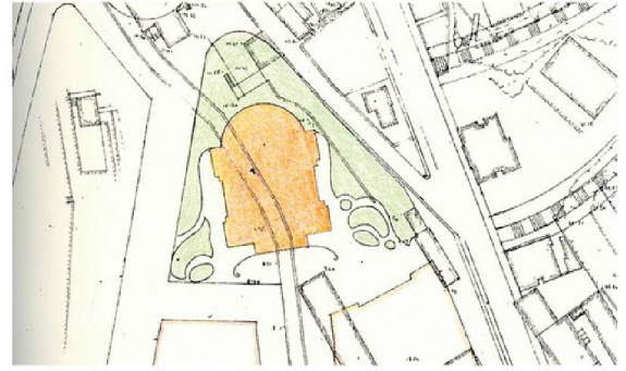
Položaj ljetnog kazališta na Potoku na planu iz 1911. godine