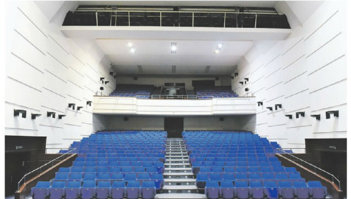
Hrvatski kulturni dom, pogled s pozornice prema gledalištu