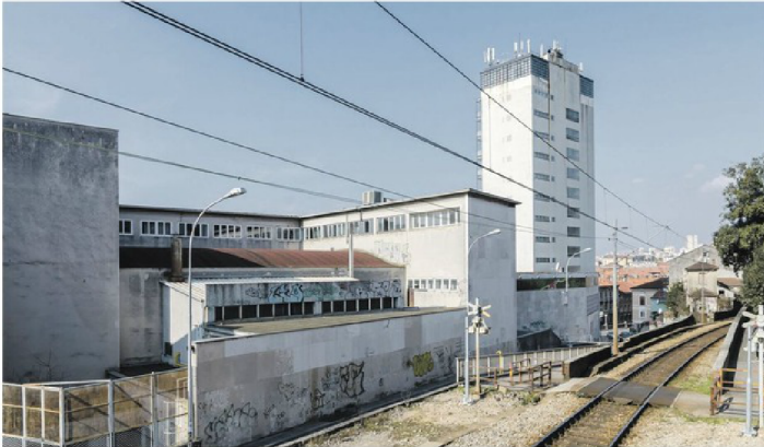
Hrvatski kulturni dom, pogled na dvoranu i sjeverno pročelje